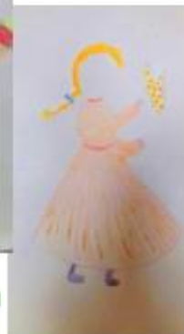
Femme de demain