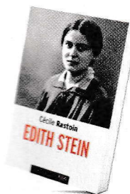
Edith Stein , de Cécile Rastoin, Éd. du Cerf, coll. LeXio, 372 p. ; 9 €.