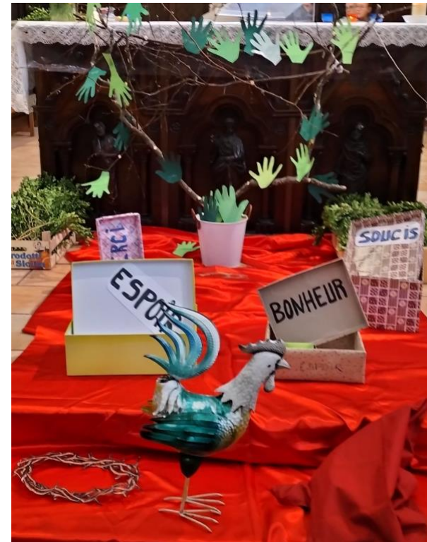
Église de Montfaucon(43) Messe des familles