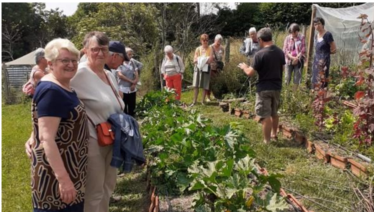
Rencontre à la ferme de Vailhac (43)

Ces différentes interventions ont donné lieu à des débats animés et très intéressants, à une prise de conscience écologique et peut être pour certaines à des changements de comportements dans leurs manières de consommer afin d'œuvrer en vue du bien commun, bien de toute femme et de tout homme et de toutes les femmes et de tous les hommes.