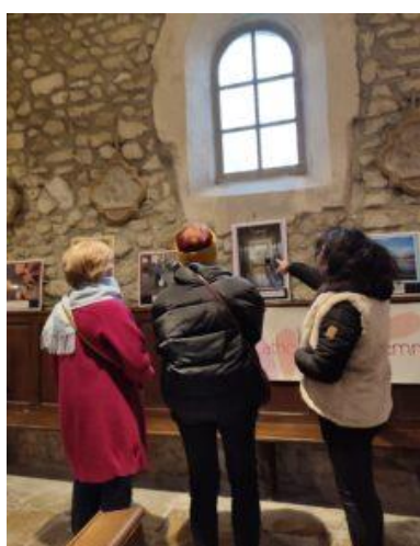
« Elles et seules » exposition photos les 9 et 10 décembre à Saint Brice (51)

En décembre 2023, trois équipes Acf du département de l'Ille-et-Vilaine , ont organisé sur le temps de l'Avent, une collecte nommée « Un hiver solidaire » en lien avec le Secours Catholique et le Secours Populaire. L'une d'elle s'est associée avec une équipe de jeunes adolescents de leur paroisse « Les Colibr'yyves ». Cette collecte a été décidée pour donner suite aux contacts pris auprès de ces deux associations. Celles-ci nous ont dit et redit leurs besoins croissants : augmentation des bénéficiaires et baisse des aides reçues des pouvoirs publics. Pendant toute cette période, les paroissiens ont fait preuve d'une grande générosité (500 pièces collectées ; vêtements chauds pour tous les âges, couvertures, duvets, produits d'hygiène.)