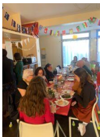
Repas solidaire du 25 décembre à Avignon (84)