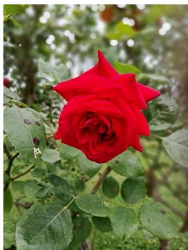
A.C.F. du Val de Marne